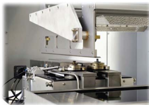
Saldatura a 0° usando i nozzle "statici"