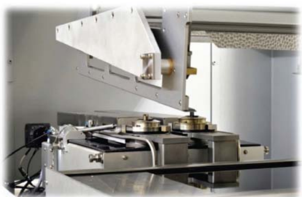
Saldatura a 7° usando i nozzle "a minionda"

La ELS 3.3 è una selettiva configurabile. Le opzioni, infatti, sono batch-handling ( in/out e nella stessa parte ) o trasportatore in-line (out parte opposta all' in). E' possibile aggiungere un collegamento Smema oppure personalizzare la macchina con diverse opzioni fornite dalla Soldercom, tipo: sistemi di carico e scarico, preriscaldi lato superiore pcbs, convogliatore di ritorno, sistemi di raffreddamento, etc