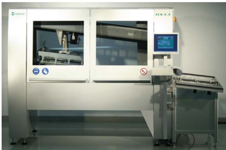
Saldatrice selettiva ELS 3.3 con minionda

ELS 3.3 è la nuova Saldatrice Selettiva di Soldercom, azienda che produce selettive con tecnologie brevettate fin dal 1992. Inoltre, questo nuovo modello si propone, ad oggi, come il più flessibile esistente nel mercato nella sua categoria.